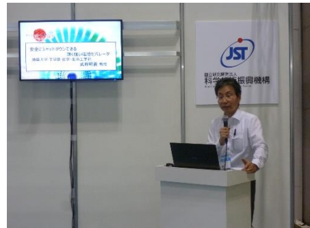
ショートプレゼン風景