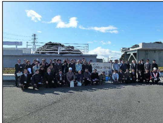
参加者による集合写真