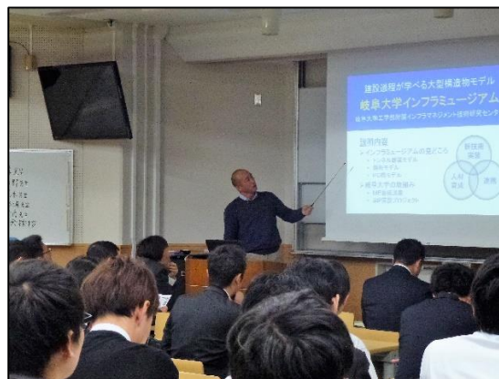
沢田センター長による説明