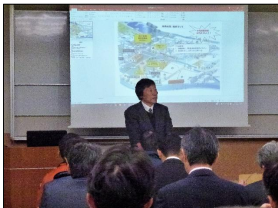
王副学長 開会挨拶