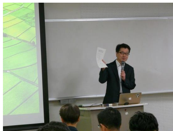
別府学部長 教育学部紹介