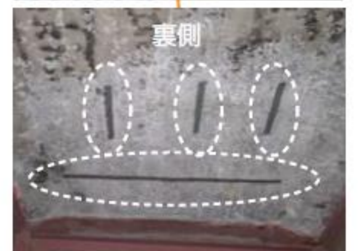
未補修のひび割れの経過観察