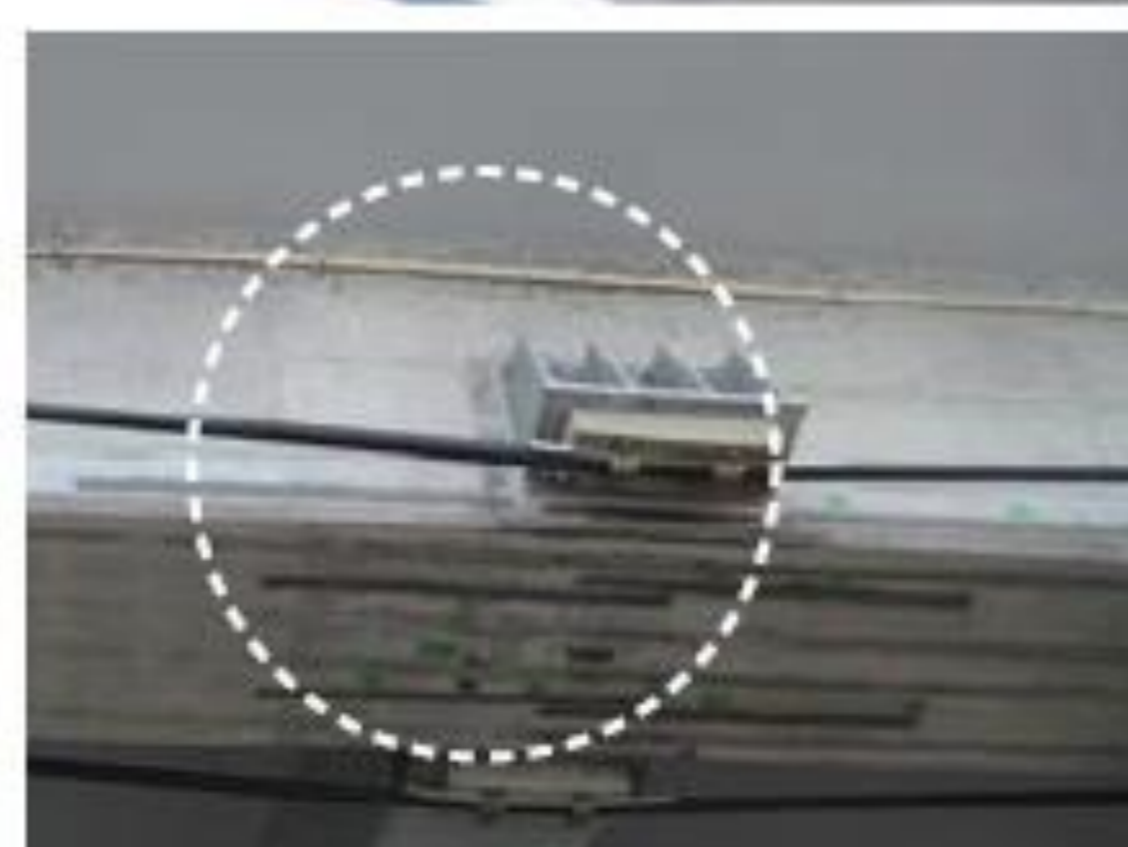
ひび割れ補修後の経過観察